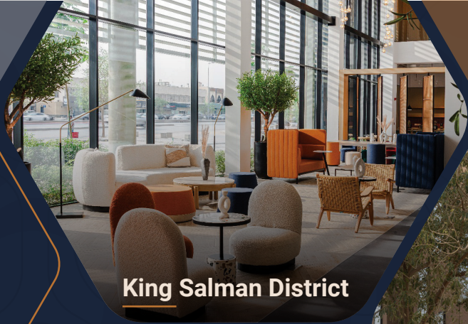
King Salman District